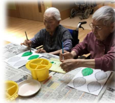
～葉っぱの色塗り中～

施設では機能訓練を月1～2回看護職員が行っています。指先運動や発声練習、上下肢の運動、タッチケア等を行い入居者様の残っている機能を維持できるようなケアを行っています。また、グループで行い普段関わりのない方と交流をしていただいたり、個別に対応することで入居者様に合わせた訓練を目指しています。みなさん楽しく参加されています！！