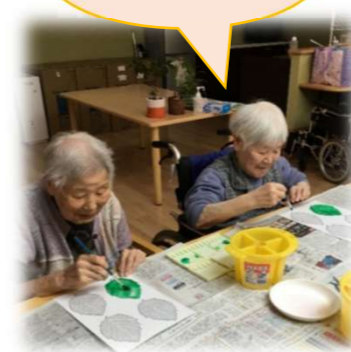
季節ごとに変化していきます お楽しみに・・・